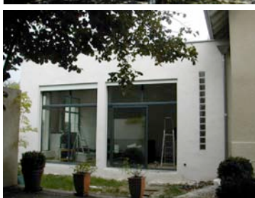
vues du chantier