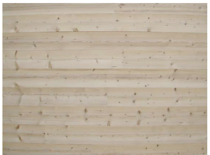
Détail ossature et bardage bois